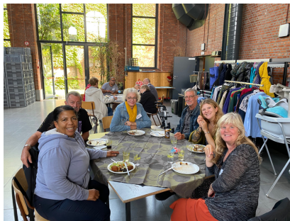
Infosessie met lunch (februari)