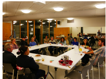
Wereld CLT-dag (oktober)

En de gemeenschap van kandidaat-bewoners blijft groeien! In 2022 deden 50 gezinnen een intake en volgden 32 huishoudens een basiscursus. We passen ons aan op de stijgende interesse en zetten nu in op collectieve intakegesprekken en een herwerkte basiscursus. Om de vinger aan de pols te houden organiseren we regelmatig opvolggesprekken met kandidaat-bewoners.