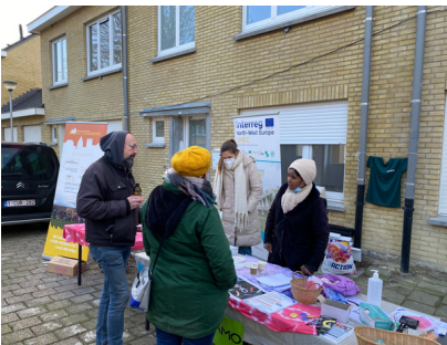
Nieuwjaarsreceptie Muide (januari)

De bewonerswerking gaat echter breder de projectgroep Mykolaiv. In 2022 organiseerden we weer verschillende gemeenschapsactiviteiten voor kandidaat-bewoners, sympathisanten en buurtbewoners.